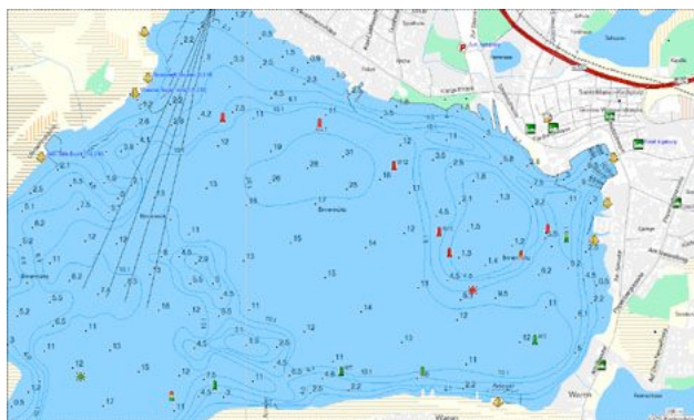
Ausschnitte der neuen Karte vom Müritze

Um den Bootsführern eine möglichst präzise und detaillierte Karte zur Verfügung zu stellen, wird die „Garmin Binnengewässer Nord-Ostdeutschland“ unter Einbeziehung von Informationen aus den anerkannten, qualitativ hochwertigen Sportschiffahrtskarten der NV-Verlagsgesellschaft (Nautische Veröffentlichungen) und den offiziellen Daten des Bundesamtes für Kartografie und Geodäsie (ATKIS) erstellt. Insbesondere bei der Abbildung der Uferverläufe ermöglicht dies eine überragende Detailtreue und Realitätsnähe .