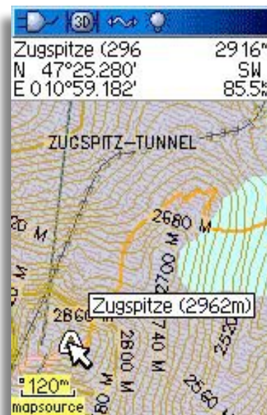
Kartendarstellung des Zugspitzgipfels auf dem GPSmap 60 CSx

Garmin Deutschland GmbH Manfred Thaler Lochhamer Schlag 5a D-82166 Gräfelfing bei München Tel.: 089-85 83 64-61 Fax: 089-85 83 64-45 E-Mail: mthaler@Garmin.de