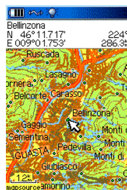
Screenshots der Topo Schweiz auf dem Garmin GPSmap 60Cx / CSx